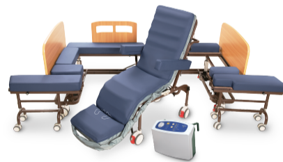
YM2000A 氣墊床型 定價12萬9千元