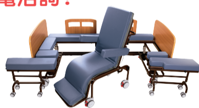
YM2000B 泡棉床墊床型 定價11萬9千元