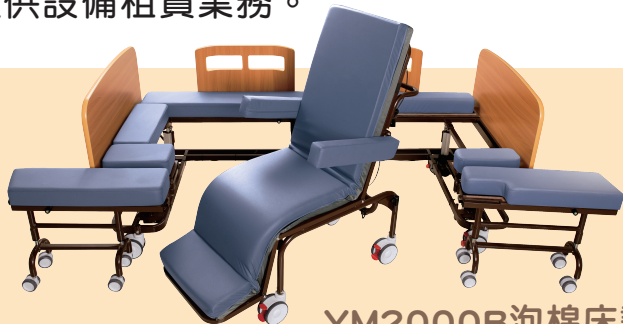
YM2000B泡棉床墊床型 另有YM2000A氣墊床型可供選擇